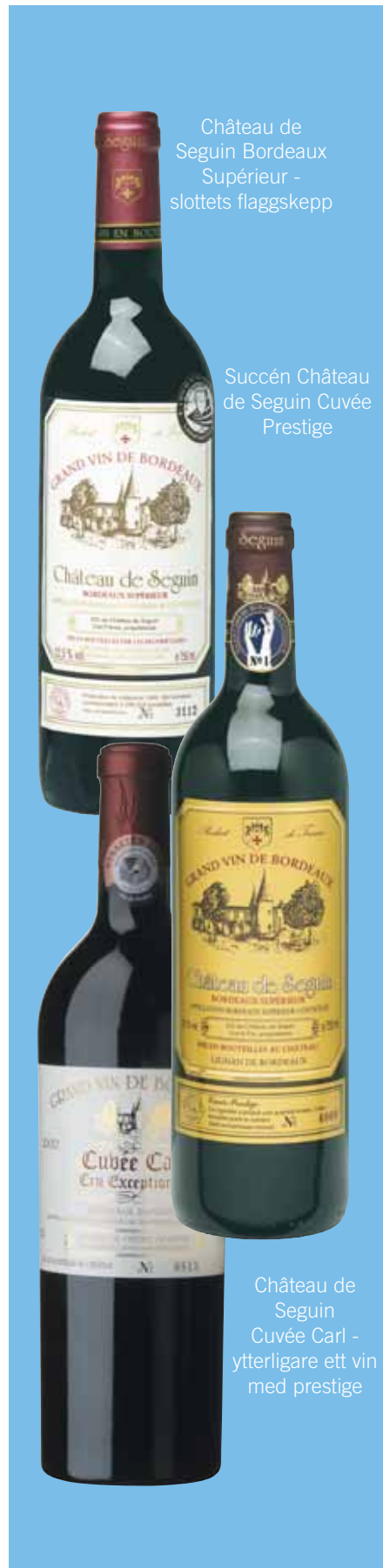
Château de Seguin Bordeaux Supérieur - slottets flaggskepp