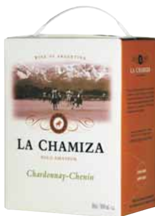
La Chamiza Chardonnay-Chenin art nr 2463

La Chamiza Chardonnay-Chenin har en frisk och kryddig doft med inslag av citrus. Smakrik och mjuk med smöriga toner från Chardonnay och friskhet från Chenin. Passar till rätter av kyckling, fisk och skaldjur. La Chamiza Chardonnay-Torrontés har en frisk och kryddig doft med inslag av citrus. Smakrik och kryddig med toner av grape. Passar till smakrika rätter av kyckling, fisk och skaldjur.